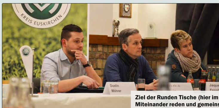
Ziel der Runden Tische (hier im Kreis Euskirchen): Miteinander reden und gemeinsam Lösungsvorschläge erarbeiten.